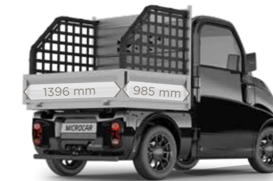
Pack PICK-UP mit optionaler Anhängerkupplung

2 VERSIONEN PASSEND FÜR IHRE AKTIVITÄTEN ! Pack PICK-UP oder Pack VAN, Sie entscheiden !